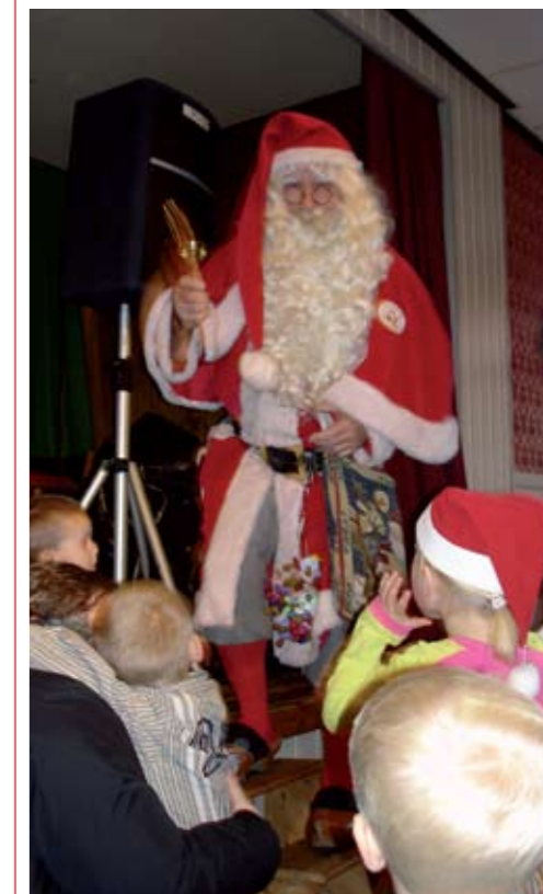
Der er musik, sanglege, dans om juletræet og godteposer til børnene, når Skovby Gamle Skoles Juletræsfest holder julefest den 16. december. Husk tilmelding